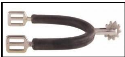
Ostrogi obrotowe z karbowanym lub ząbkowanym brzegiem